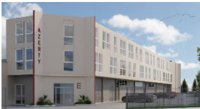
Perspective du projet Ampère Village situé à Pontoise dans le Val-d'Oise.

Île-de-France Investissements et Territoires , SEM patrimoniale de la Région Île-de-France , s'est associée en co-investisseur minoritaire à la foncière Soremi pour l'acquisition du parc d'activités Ampère Village situé à Pontoise, dans le Val-d'Oise.